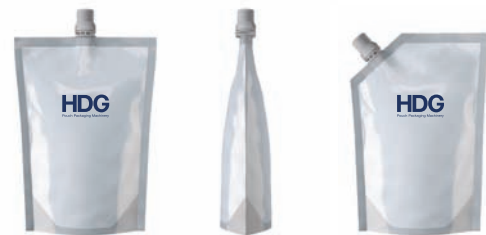
Standbodenbeutel im Doypack-Stil mit Ausgießer

So kann neben einer besseren Präsentation am Point of Sale zugleich die hygienische und sichere Lagerung von Produkten garantiert werden, die über den Einmalbedarf hinaus gehen.