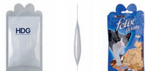
3-Rand-Siegelbeutel mit Kontur