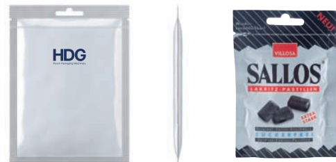
4-Rand Siegelbeutel mit Euroloch und Zipper