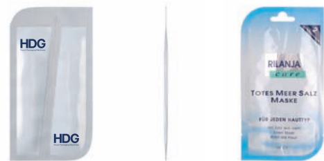
4-Rand Doppelbeutel mit Perforation u. Kontur

HDG bedient die Ansprüche unterschiedlichster Branchen wie z.B. der Nahrungsmittel-, Tierfutter-, Kosmetik-, Chemie- und Pharmaindustrie.