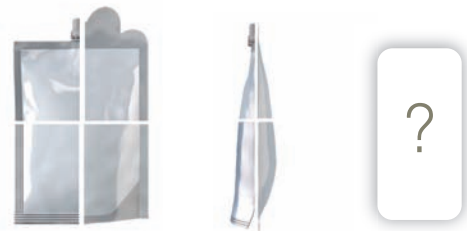
Ihr Beutel nach Maß