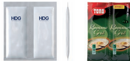
4-Rand Doppelbeutel mit Perforation